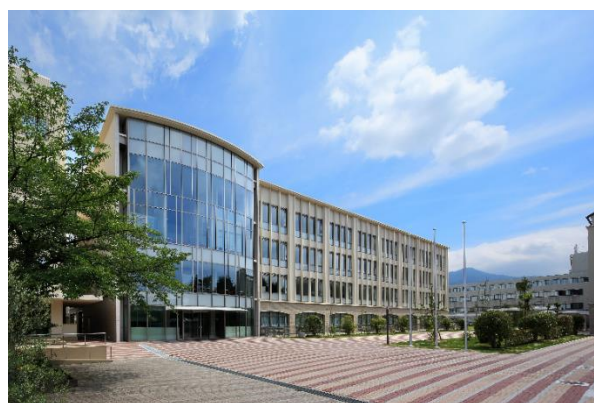
京都ノートルダム女子大学