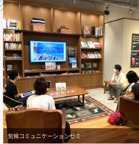
気候コミュニケーションゼミ

気候コミュニケーションゼミ / 嵐山もみじ祭ゼミ / ワークショップ・デザインゼミ / KNDUの“イトコ”を学外に発信！プロモーションゼミ / 京都大学硬式野球部集客アップゼミ