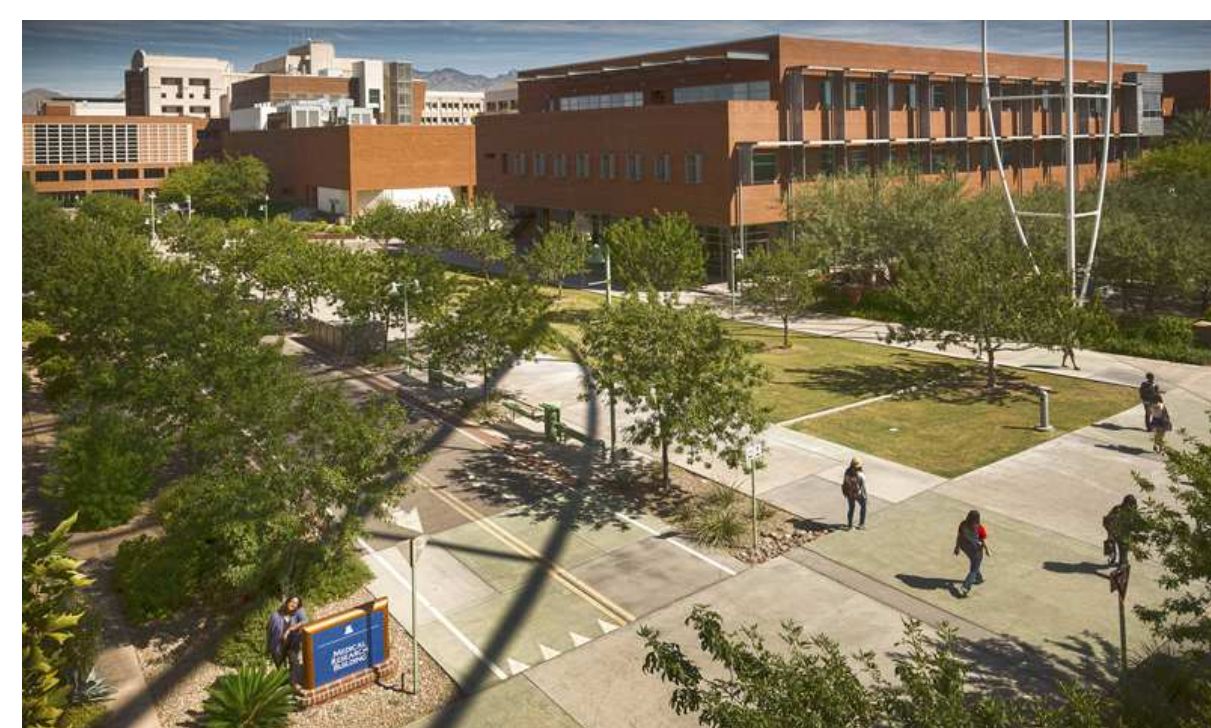
「アリゾナ大学メディカルスクール」

この研究の目的は、近年アメリカの大学図書館において注目を得ている「エンベディッド・ライブラリアン」と呼ばれる、図書館という場所ではなく、図書館の利用者がいる場所において提供される情報提供、情報探索支援サービスが、大学の研究者や学生にどのように認識されているのかを調査することです。本研究は、このサービスに以前から取り組んでいるアリゾナ大学医学図書館の専門職員らと共同で行います。具体的には、アリゾナ大学薬学部に所属する研究者、学生を対象にし、研究、学習に必要な情報を探す上でのこのサービスの位置付けに関する調査を行います。インタビュー調査により、図書館サービスの利用者の情報行動に、このサービスがどのような影響を与えているのかを分析することがこの研究の中心となります。