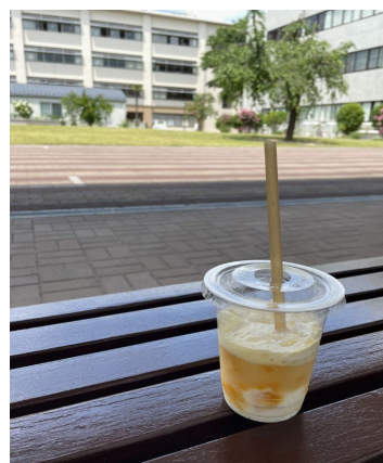
炭酸ヨーグルト販売の様子