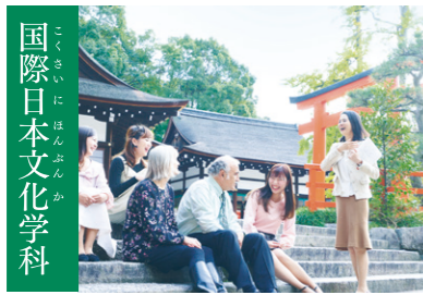
国際日本文化学科