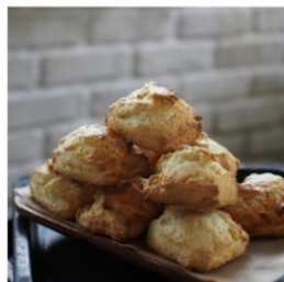
プレーンスコ ーン 200円