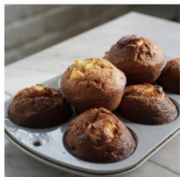
キャロットマ フィン 200円