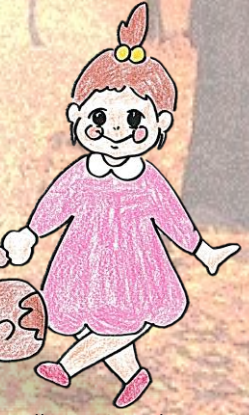
Illustration by K.Suzuna