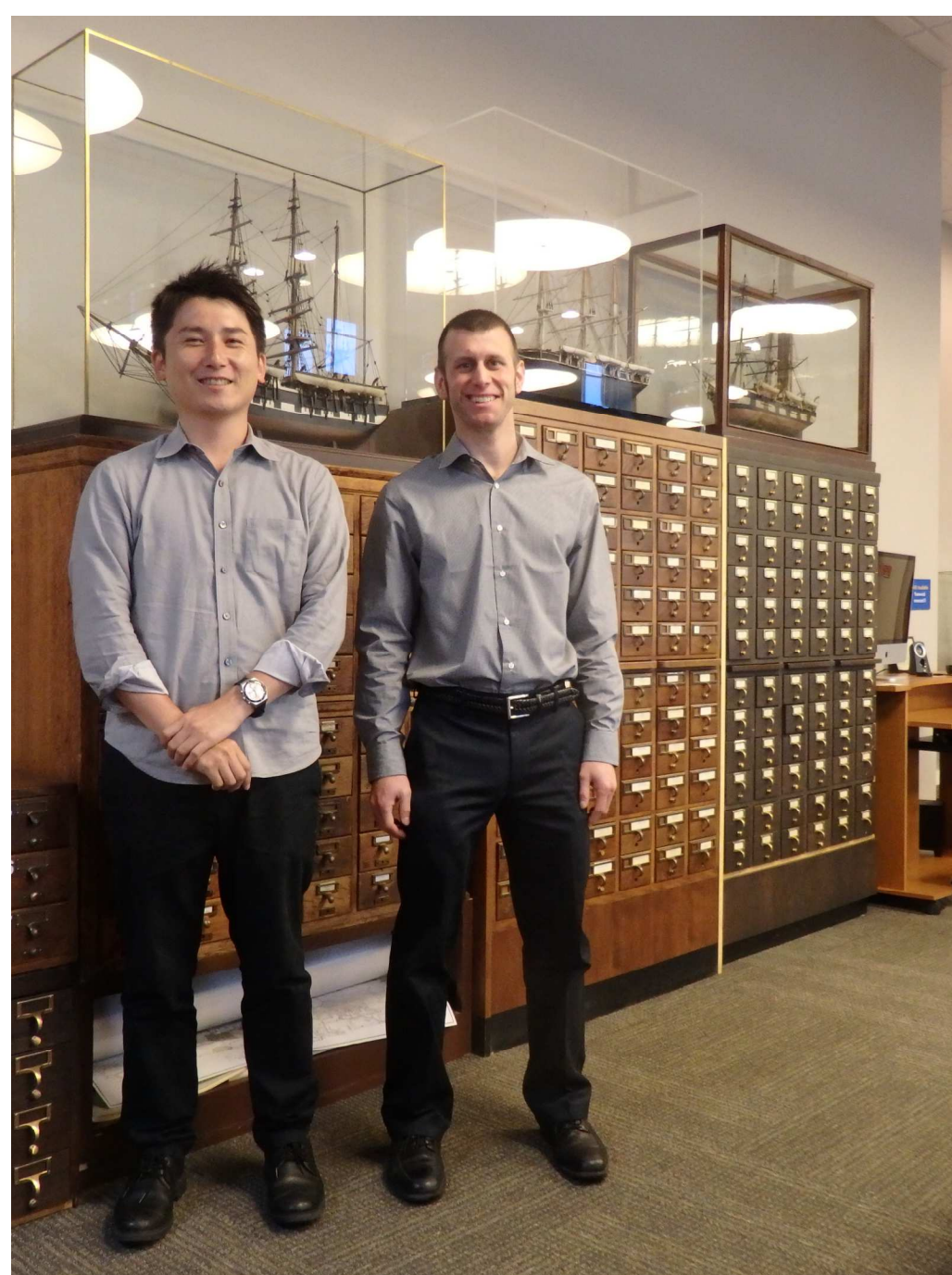
The Library of New Bedford Whaling Museumにて

・共訳 『アメリカン・カルチュラル・スタディーズ-ポスト9・11から見るアメリカ文化』 萌書房、2012年