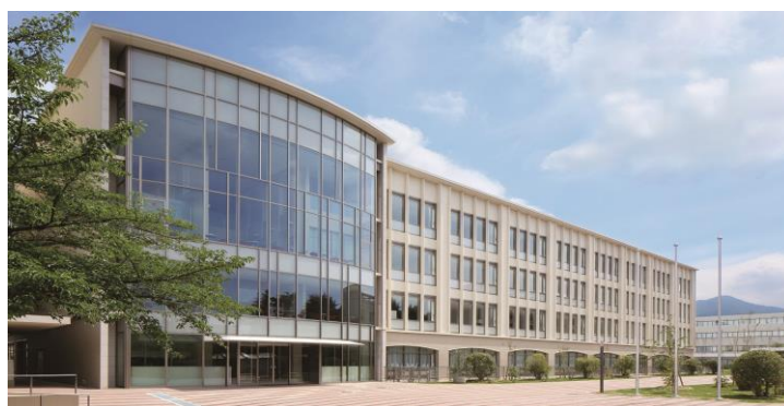
京都ノートルダム女子大学

報道機関の皆様におかれましては、是非ともご取材いただきますようご案内します。取材いただける場合は、以下まで申込みください。